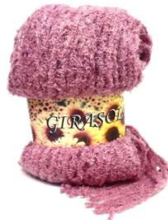
ReteCiniglia "Girasole" 0232/7